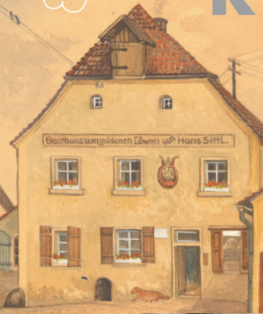
Der Löwe 1946