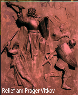
Relief am Prager Vitkov